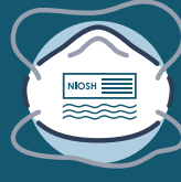
Правильно надягнений респіратор N95