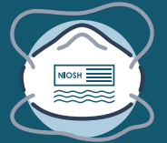
Правильно надягнений респіратор N95

*Необхідні ЗІЗ залежатимуть від необхідного рівня ізоляції. Змінійте ЗІЗ і порядок дій відповідно.