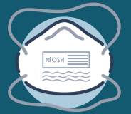
Правильно надягнений респіратор N95

*Необхідні ЗІЗ залежатимуть від необхідного рівня ізоляції. Змінійте ЗІЗ і порядок дій відповідно.