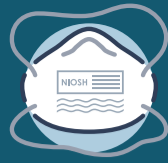
Правильно надягнений респіратор N95